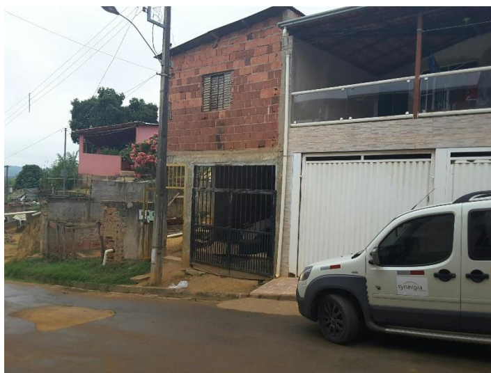
Figura 1. Registro fotográfico da visita.

Em visita realizada no dia 31/03/2017, equipe técnica da empresa Synergia esteve no local de residência informado pelo manifestante, contudo não foram encontrados residentes. Em contato telefônico no mesmo dia, Juliana (Cônjuge do manifestante, portanto integrante da composição familiar), informou que a família se mudou para outra rua em Belo Oriente - Cachoeira Escura, sem esclarecer mais detalhes. No dia 09/06/2017, equipe técnica da empresa Synergia, enviou SMS para os números declarados pelo manifestante, com o objetivo que a família entre em contato com a empresa para realização do Cadastro Integrado.